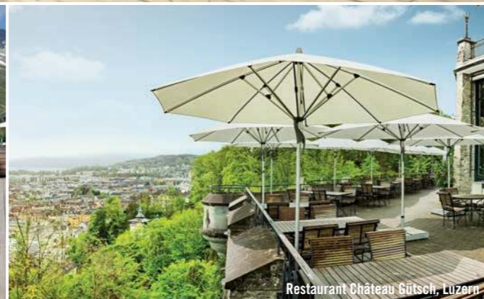
Restaurant Château Gütsch, Luzern