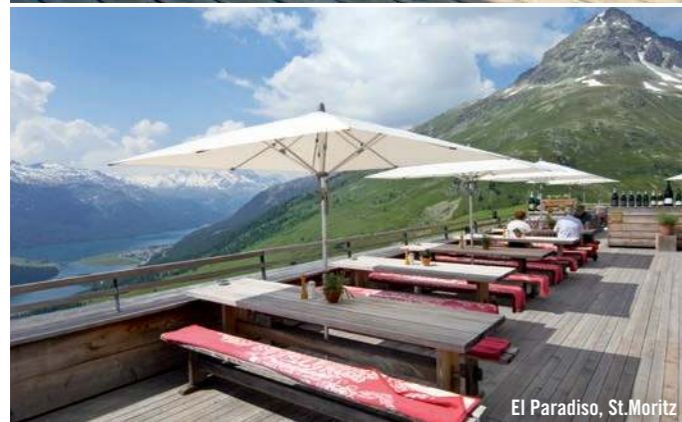
El Paradiso, St. Moritz